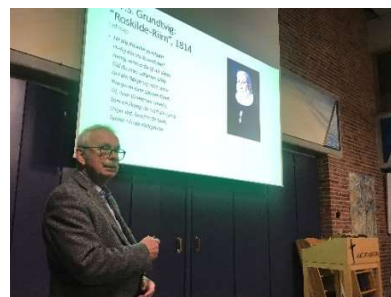
Roskildes kilder og møller d. 25.9.2023