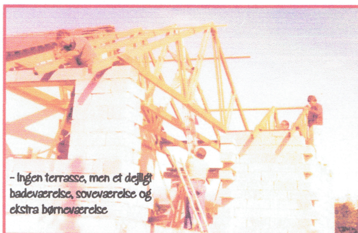
- Ingen terrasse, men et dejligt badeværelse, soveværelse og ekstra børneværelse