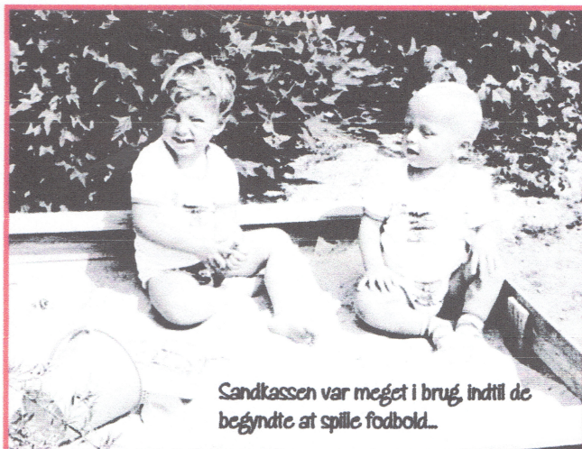
Sandkassen var meget i brug, indtil de begyndte at spille fodbold...