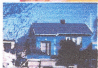
Anno 1975 - incl. vores første "barn" - Snoopy