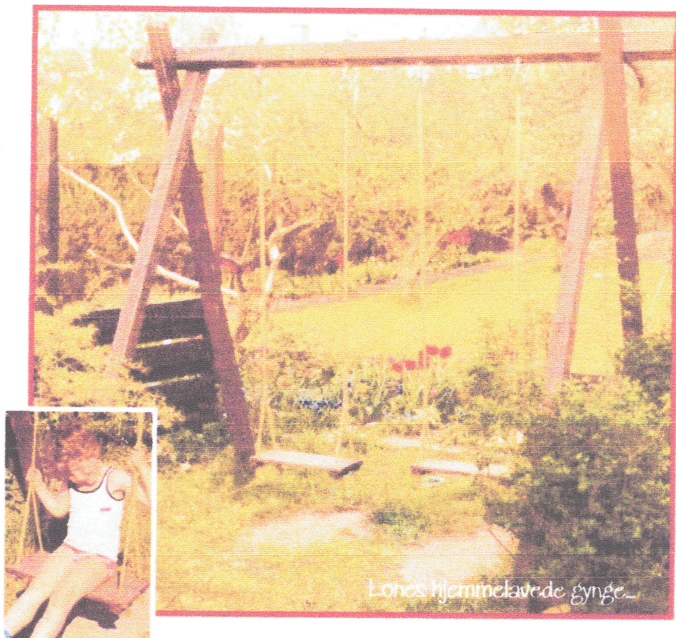
Lones hjemmelavede gyngesæde...