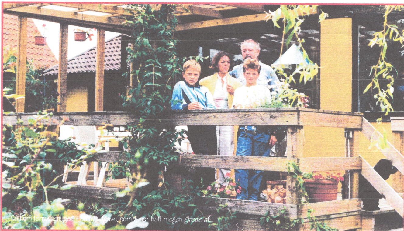
Så kom terrassen igen - en ny udgave, som vi har haft megen glæde af...