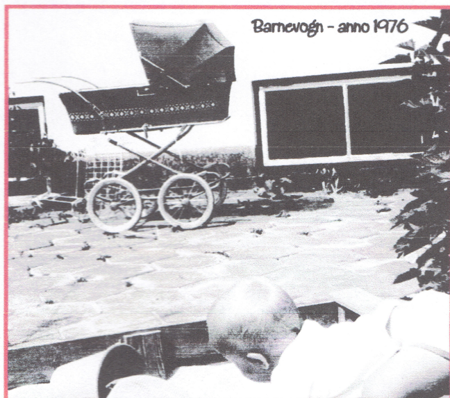
Barnvogn - anno 1976