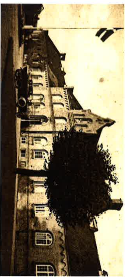
Hovedbygningen i Nonnegården med sygeafdelingen

Han var indvalgt i sygehusbestyrelsen i 1872, og var sikkert en rejskaffen mand, hvorfor han kunne ikke leve med denne for ham utålelige statistik, og især ikke da bestyrelsens flertal, som et svar på den dårlige statistik, valgte "kassetænkning" frem for at tage et socialt ansvar. Da sygehusbestyrelsen sikkert måtte påtage ansvaret for det dyre indkøbte marmorbadekar, der aldrig fik den ønskede virkning, har det sikkert ligget til højrebænet at skaffe en alternativ indtægt ved at tilbyde borgerne i Roskilde at komme ud på Køgevej, og ind i "Nonnegården," hvor sygeafdelingen lå i den sydlige fløj, og hvor de ledige baderum mod betaling, nu var til rådighed.